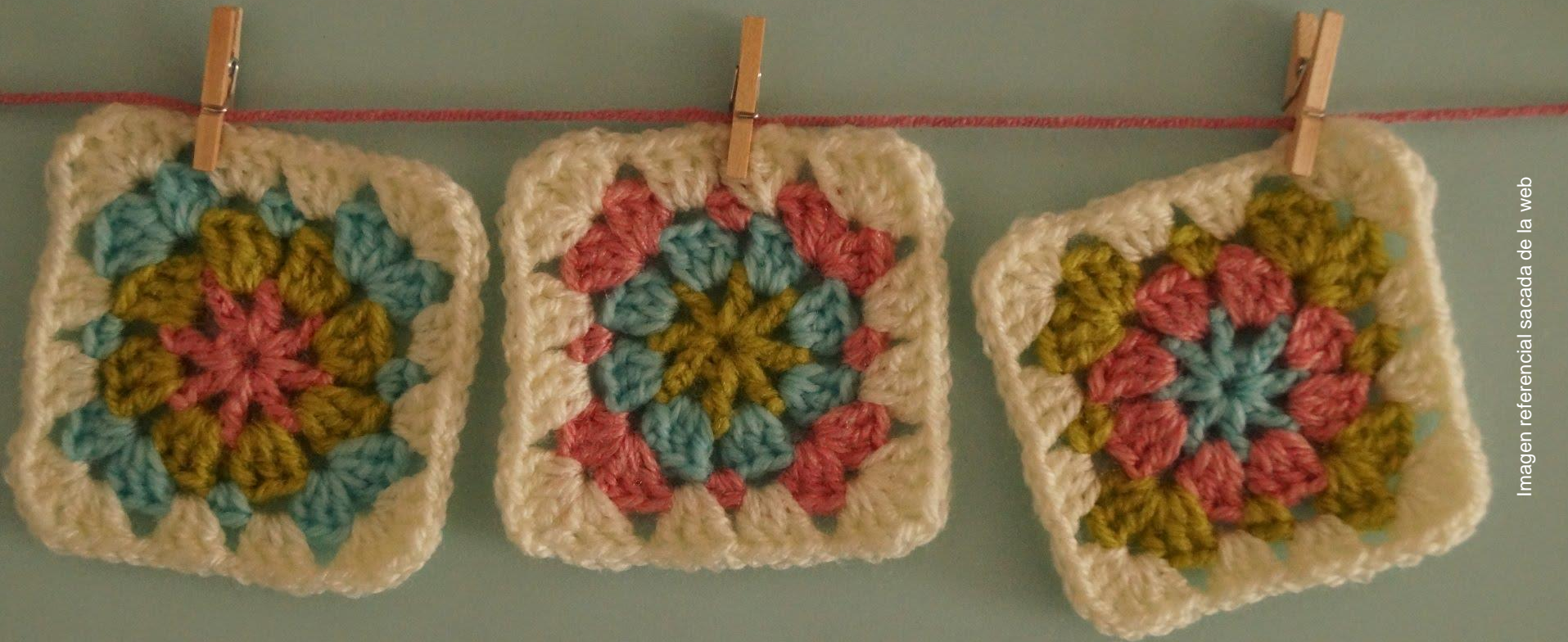
Imagen referencial sacada de la web