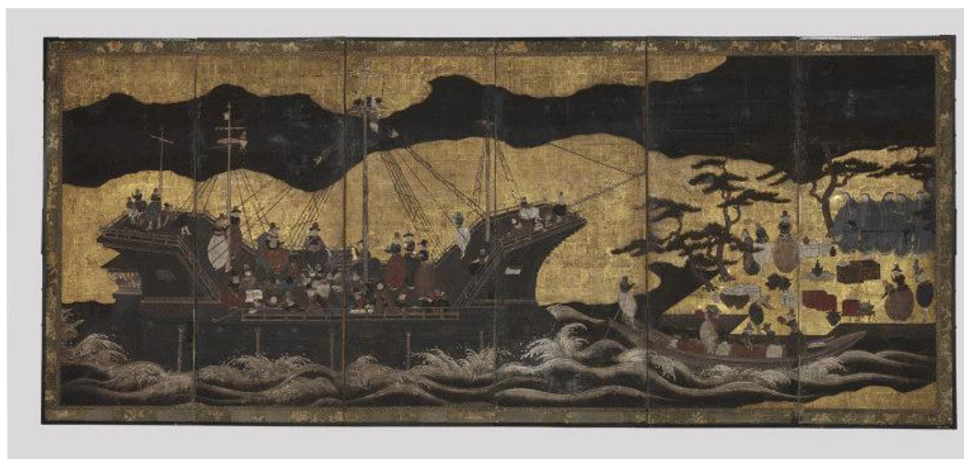
Imagen 3: Biombo japonés que muestra el arribo de un barco portugués | ca. 1600-1630 | Museo Victoria & Albert, Londres

Así también, prontamente los misioneros cristianos comenzaron a instalarse en la región, generando profundas reticencias entre las autoridades niponas quienes optaron por cortar cualquier tipo de contacto con los extranjeros. De este modo el archipiélago se mantuvo aislado por cerca de 250 años, hasta que en 1854 los EE.UU. obligaron militarmente a los japoneses a abrir su economía. A partir de este momento se inició un comercio intensivo entre Japón, Europa y las América, favoreciendo la circulación de los objetos de lujo que eran producidos por los artífices isleños.