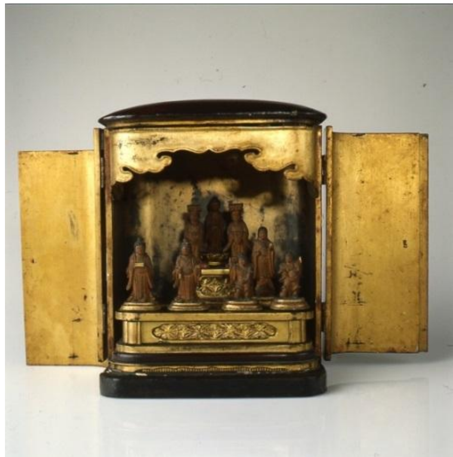
Imagen 2: Altar budista | madera tallada y lacada | Japón, ca. siglo XIX | Colección MAD | n° inv: 24.83.1150

El arte japonés demostró “[...] la amplitud de miras y la flexibilidad del espíritu artístico de Japón, sumido en continuas inundaciones culturales precedentes del continente de las que resurgió con una gran capacidad de selección y adaptación, siempre presto a redescubrir sus propias raíces artísticas” 1 . En este sentido, en las artes niponas se operó un doble movimiento, ya que, por un lado, se avocaron a la imitación de modelos foráneos y, por otro, dieron cabida a la expresión de su identidad (véase imagen 2). Las creaciones japonesas, en líneas generales, se caracterizan por una profunda emotividad, la sutileza de las formas, amor por la simplicidad, gusto por las texturas, formas y color.