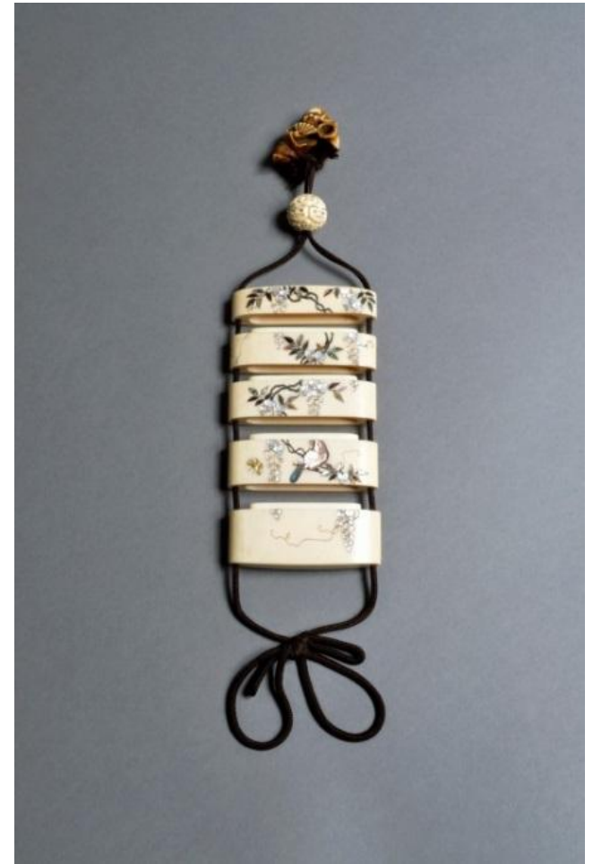
Imagen 10: Inrô desplegado | Japón | Marfil tallado con decoraciones | Colección MAD | | n° inv: 24.89.847

El Inrô fabricado en marfil es de forma rectangular, y se compone de 5 secciones desplegadas; cuyas medidas son: 8,7 x 6,3 x 1,4 cm. (véase imagen 10).