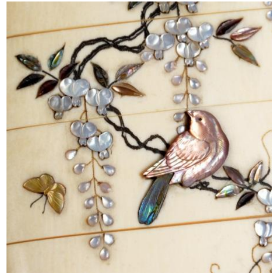
Imagen 11: Glicinia japónica